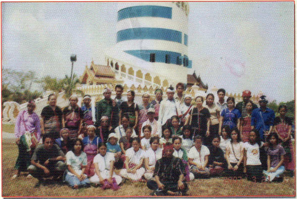
တၢ်လံၤတးယုၤပှၤတစၢၤဒိၣ်လၢဂုၤတကျိၣ်