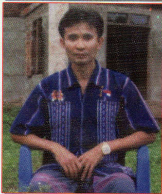
သရဉ်ကလုာ်ထူ (ကးလံဉ်တြိာ်ကဝီမူဒါဒိဉ်)