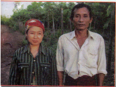
ကံာ်ပီၤတံာ်မာလီၢ်