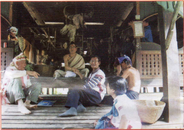
တၢ်လံၤအိၣ်သကိး ဗုၣ်ကွၢ် လၢလုၤတီၤဒိၣ်