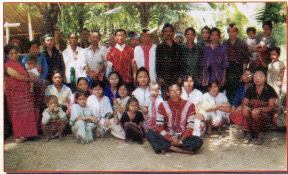
ပှၤတလးကျိၣ်ဖိလၢ လုၤတီၤဒိၣ် ဒီးဘျာထံဝံၤတဖၣ်

ထံကပိာ်တၢ်မၤလိာ်အံၤ ပှၤခရံၣ်ဖိအဟံၣ်အိၣ်ဝဲ(၁၀)ဖျၢၣ်ဒီး တမ့ၢ်ဒဲး ခရံၣ်ဖိဟံၣ်အိၣ်ဝဲ (၁၀၀)ဖျၢၣ်န့ၣ်လီၤ. ခရံၣ်ဖိနီၣ်ဂံၢ်အိၣ်ဝဲခဲလၢဝဲ(၂၅)တၢ်လီၤ. ပှၤလၢအကွၢ်ထွဲဒီးဟ့ၣ်လီၤသးလၢ ထံကပိာ်တၢ်မၤလိာ်အံၤ မ့ၢ်ဝဲ သရၣ်တၢ်ဘျူးဒိၣ်န့ၣ်လီၤ. ပှၤလၢအဆိၣ်ထွဲမၤစၢၤထံကပိာ်တၢ်မၤလိာ်အံၤမ့ၢ်ဝဲ နီၣ်အိၣ်လၢဝဲအခူၣ်ဖိထၢဖိ အိၣ်ဝဲလၢကီၢ်စွဲးဒိၣ်န့ၣ်လီၤ.