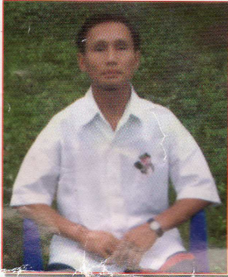
သရဉ်အိဉ်ဒိဉ်ဖိ (ဟးဒုးဝဲကျိအိဉ် စိဉ်တဲာ်တဲာ်လိာ်မဲဉ်သကိးမဲဉ်)