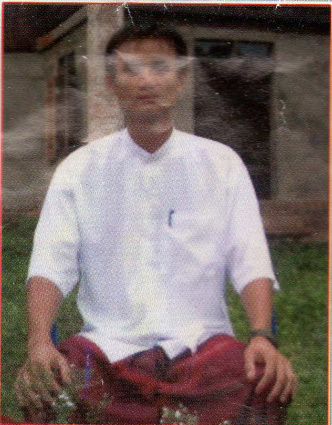
သရဉ်စးသး (သီပုာ်မုာ်န့ဉ်ကဝီမူဒါဒိဉ်)